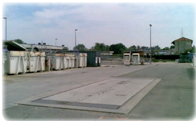
Figura 2 – Pesa ecocentro di Vercelli.

L'operatore del centro, poi, segnerà sulla scheda elettronica personale la quantità e la tipologia dei rifiuti qui conferiti. Al fine di dare luogo ad un rapporto trasparente con l'utenza, l'operatore rilascerà a fine operazioni un scontrino indicante la data e l'ora del passaggio oltre alle informazioni relative ai rifiuti conferiti. Per poter quindi calcolare i quantitativi e la natura delle singole frazioni merceologiche, è opportuno che il centro sia dotato di una pesa e di un servizio di accompagnamento dell'utenza nel sito affinché le operazioni di conferimento risultino certe e veloci.